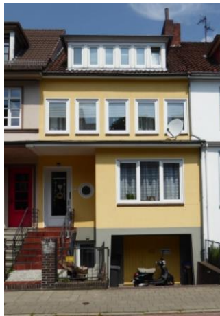
Manteuffelstraße 32, Foto: Peter Strotmann, Aufnahmejahr 2018

Die Manteuffelstraße ist nach dem preußischen Generalfeldmarschall Freiherr von Manteuffel (1809–1885) bezeichnet.