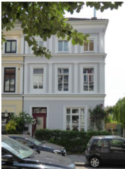
Uhlandstraße 11, Aufnahmejahr 2018