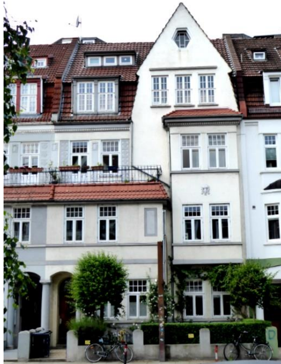
Graf-Moltke-Straße 7, Aufnahmejahr 2018

Die drei Mehrfamilien-Reihenhäuser Graf-Moltke-Straße 5, 7 und 9 wurden von den Architekten Kayser und Jatho entworfen. Nummer 9 ist ein Endhaus. Die Nummern 5 und 7 sind spiegelsymmetrisch angeordnet, das heißt die Hauseingangstür liegt bei Nummer 5 auf der rechten, bei Nummer 7 auf der linken Hausseite. Damit sind auch die Treppenhäuser in den Wohnungen und die Küchen seitenverkehrt angeordnet. Das bewirkt, dass von diesen Räumlichkeiten ausgehende Geräuschbelästigungen im Mittelbereich verbleiben und nicht auf die Wohnräume übertragen werden.