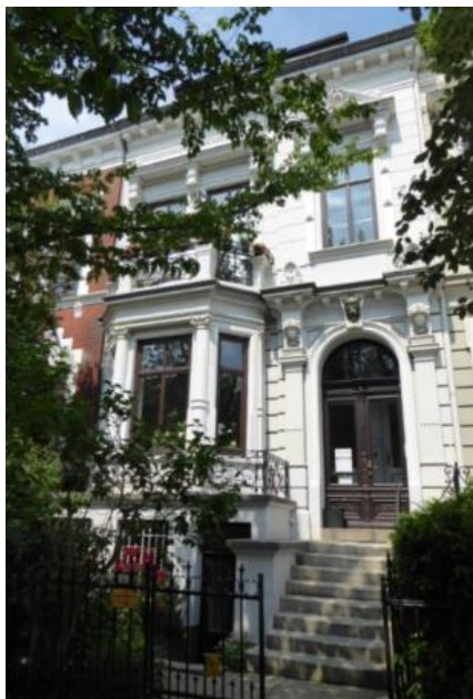
Uhlandstraße 42, Aufnahmejahr 2018